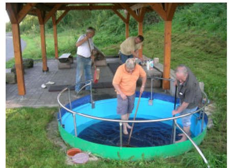
Bild vom Freiwilligentag in Ludwigsau-Rohrbach am 24.09.2011 – Reinigung des Wassertretbeckens

Vielen herzlichen Dank an die Freiwilligen, die am 2. Freiwilligentag mit angepackt haben. Bei herrlichem Sonnenschein wurden zahlreiche Projekte umgesetzt. Wir möchten das freiwillige Engagement würdigen und werden am 04.11.2011, anlässlich des Workshops „Ehrenamt“, eine Ausstellung über die verschiedenen Aktionen zum Freiwilligentag präsentieren.